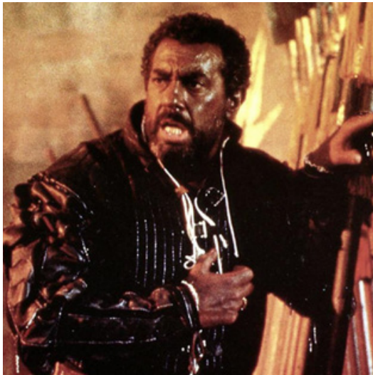
Othello, am Ende des Bärenmarktes

Die kritische Durchsicht der Bestände erfolgt in einer ähnlichen Haltung, wie sie Schriftsteller ihren Texten vor der Abgabe beim Verlag einnehmen. Während in der eigentlichen Schreibphase der Fantasie freier Lauf gelassen wird und jeder Einfall seinen Weg auf das Papier findet, steht am Ende des kreativen Prozesses die Kritik – insbesondere gegen die Lieblinge. Jeder Autor hat in seinen Texten gewisse Wendungen, Sätze und Szenen, die er für besonders gelungen hält, die ihm geradezu brillant erscheinen und die ihm jene Freude bereiten, die für alle mit diesem Beruf verbundenen Entbehrungen entschädigt. Diese Darlings sind aber, so stellt es sich meistens heraus, nur für den Autor, nicht den Leser geschrieben. Das heißt, sie bringen den Rest der Erzählung nicht weiter, sind nur dekorativ und tragen zur inneren Entwicklung des Stoffs nichts bei. Das sind häufig Textstücke, die in einer früheren Version einen Sinn hatten, diesen nun aber verloren haben. Diese Lieblinge gilt es bei der Revision zu ermorden, wenn der Autor (wörtlich genommen) einen »anderen Blick« auf seinen Text wirft.