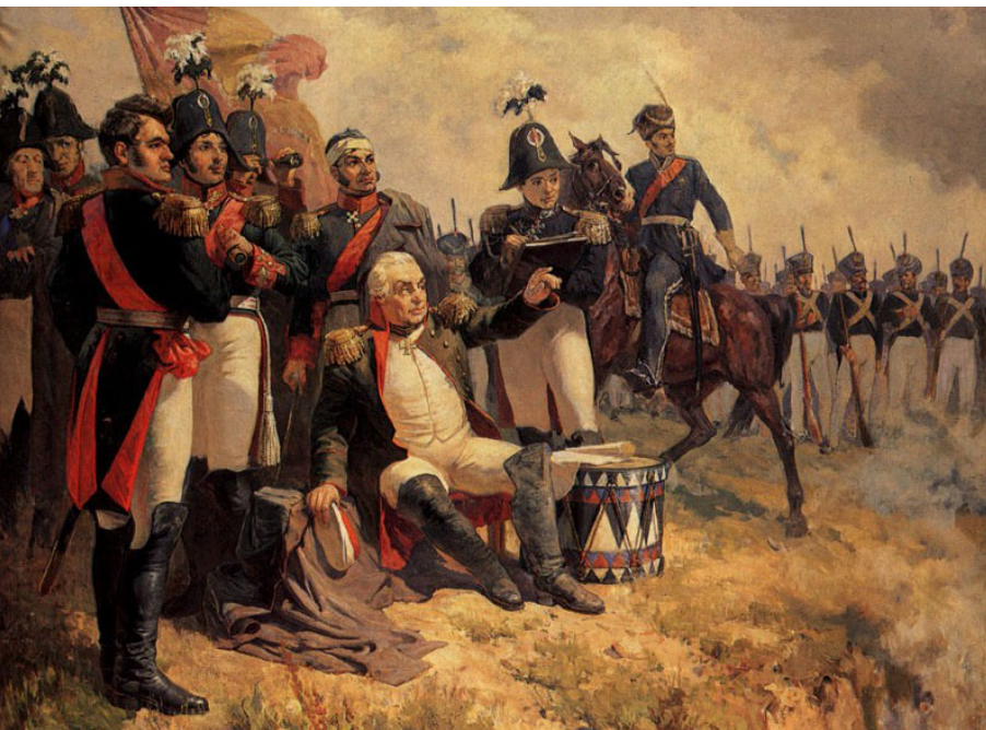
Da verlieren wir gerade Moskau ...

Wertmaßstäbe an. So weit, so gut. Aber Investment-Entscheidungen erschöpfen sich nicht in der Analyse von Zahlen, denn das einzig Gewisse sind die Kurse von gestern und vorgestern. Der Blick in die Zukunft hängt von früheren Überzeugungen ab und ist von unvollständigen Informationen und Missverständnissen getrübt. Entscheidungen sind also bestenfalls auf gut fundierten Wahrscheinlichkeitsüberlegungen gegründet.